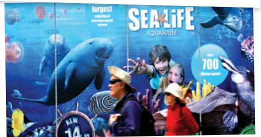
豐富多彩的悉尼活動任君選擇