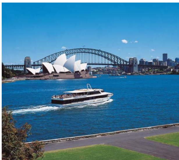
美麗的悉尼歌劇院和海港大橋