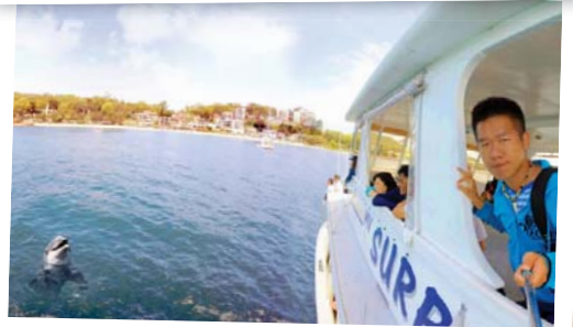
在史提芬港邂逅野生海豚